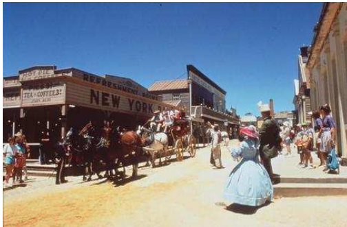
疏芬山中世纪小镇

途经巴拉瑞特, 一定要去野生动物园 (Ballarat Wildlife Park) 享受与澳大利亚本土动物亲密接触的美妙感觉。喂一喂自由跳跃的袋鼠, 抱一抱憨态可掬的考拉。有时间的话也可以顺便游览参观一下澳大利亚最古老的区域画廊巴拉瑞特精品画廊 (Ballarat Fine Art Gallery), 此画廊建于 1884 年, 是全国最重要的艺术作品收藏中心之一。