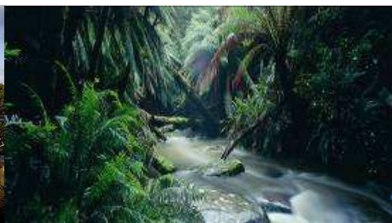
大洋路边茂密的雨林

当晚我们为自驾客人精选了大洋路沿途小镇中极具澳洲特色的酒店入住,但是由于小镇中的特色酒店普遍房间较少,而大洋路沿岸又是澳洲人酷爱的度假胜地,我们会根据当日房态为客人选择以下特色酒店住宿: