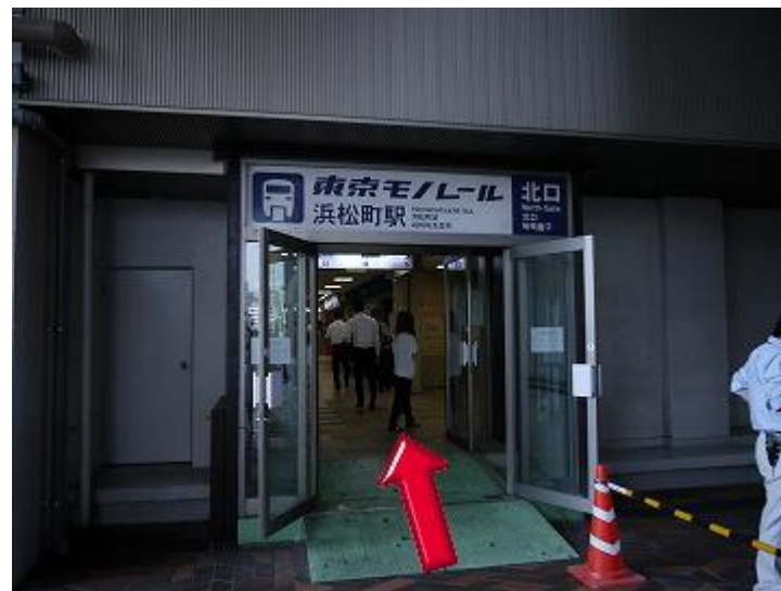
4、进入上图所示的入口