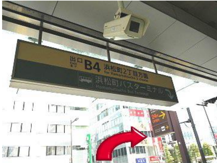
1、从 B4 出口出来后右转并直走