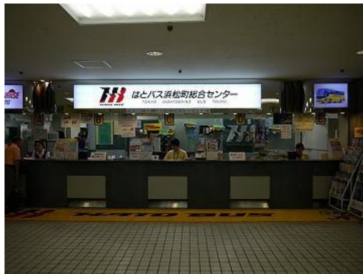
8、下来后正对面即为哈多巴士滨松町综合中心。