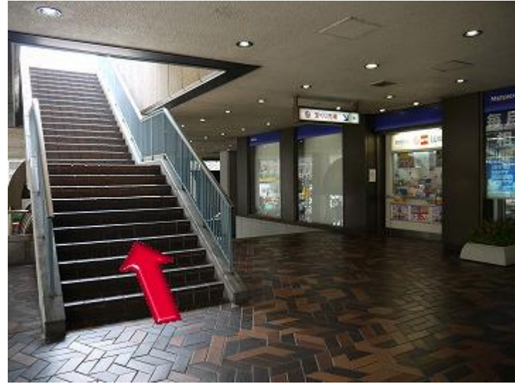
2、正面入口的左侧有个彩票投注站。从彩票站前的台阶上楼