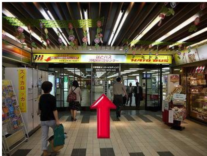
5、向前走进入世界贸易中心（此处为2楼）