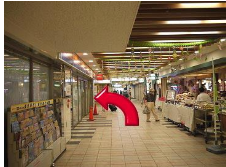
4、直走，在第一个路口的便利店处左转