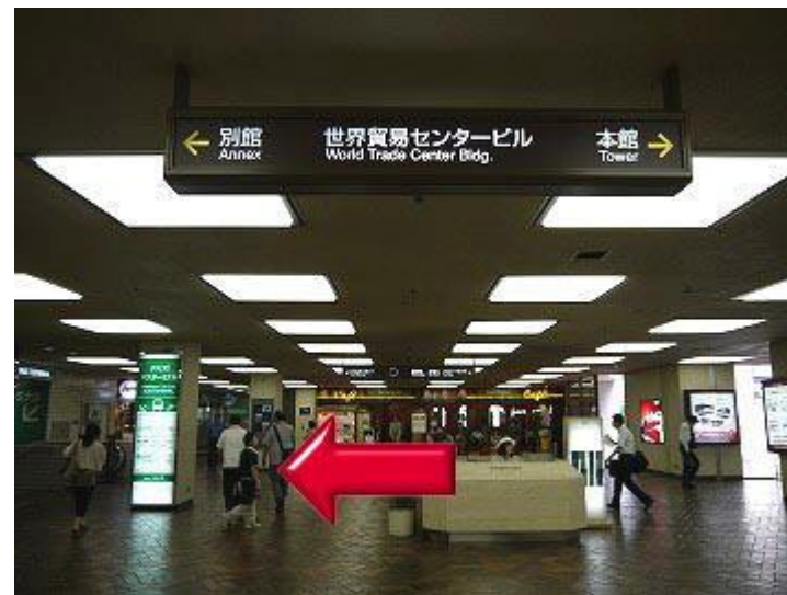
6、巴士总站在大楼的别馆。走过资讯台向左转。