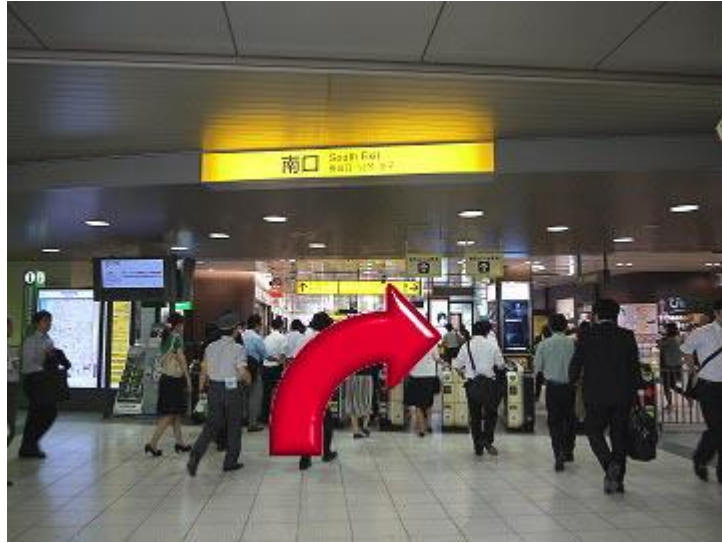
1、从 JR 滨松町站的南口出站后，向后转