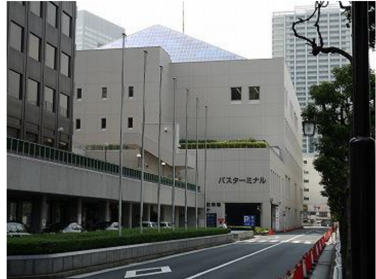
2、正前方可以看见巴士总站大楼