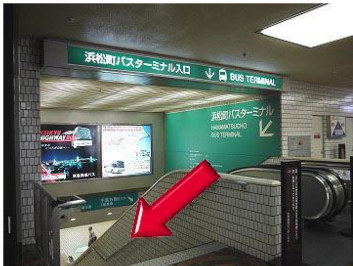
7、沿着扶手梯或台阶下楼（下面为一楼）