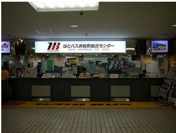
7、下来后正对面即为哈多巴士滨松町综合中心。