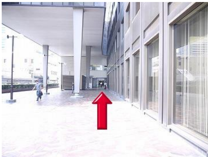
3、上楼后右转，向前走