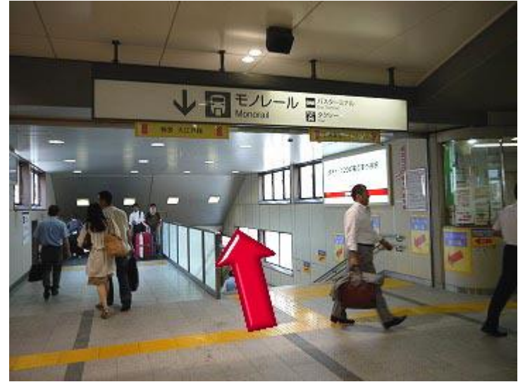
2、沿着扶手梯或台阶下去