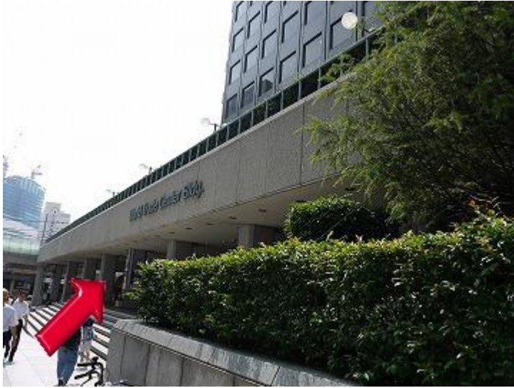
1、此图为世界贸易中心大楼的正面入口